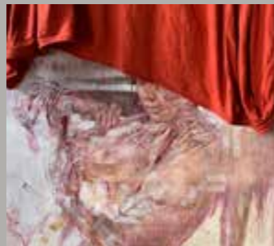
The sound and the fury nach William Faulkner / Red Graphit, Eitempera, Harzölfarbe/ Lw