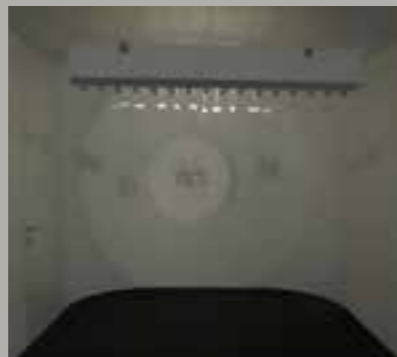
„shadow maker“ Metall / Leuchtdiode