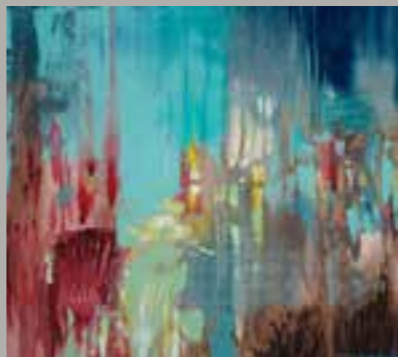
Soulscapes#13, Öl auf Leinwand

Zahlreiche Einzel- und Gruppenausstellungen in Österreich, Frankreich, Schweiz, USA, Russland, Deutschland, Bulgarien, Israel.