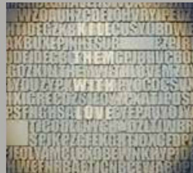
KILL THEM WITH LOVE, Acryl, Lack und Holz auf Holz

- 2019 „Women's Day“ , DOP - Dokumentarfilm Reg. Dolya Gavanski UK/Russland/Deutschland/Bulgarien